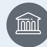
Musées & lieux de patrimoine