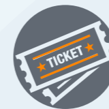
Arts de la scène et festivités