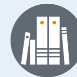
Livres et presse