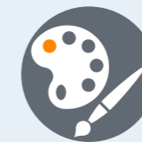
Arts visuels et artisanat