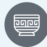
Héritage culturel et naturel

La structuration et professionnalisation du secteur devient donc prioritaire aujourd'hui pour le développement d'une industrie pérenne, vectrice de développement socio-économique à l'horizon 2030 et s'inscrit complètement dans la vision de développement socio-économique du pays.