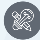
Design et services créatifs