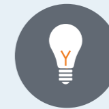
Publicité et communication